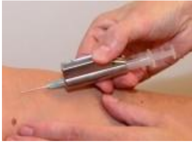
Afname pus met spuit

Alleen bij zeer kleine hoeveelheden de pus met behulp van een E-swab afnemen. Maak dan de HIX / ZorgDomein order aan onder tabblad “Uitstrijk”.